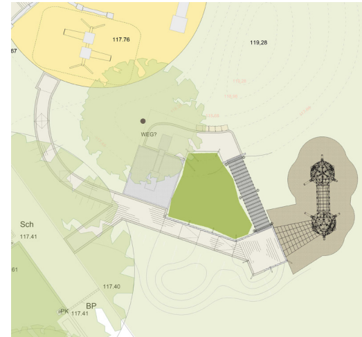
Plan zur Realisierung des Kletterangebots im Lutherpark Witten.

Auf den Spielplatz im Lutherpark in Witten. Gemeinsam mit dem Kinder- und Jugendparlament wollten wir Kindern im Rollstuhl ermöglichen, am Spielplatzleben teilzunehmen. Wir haben die Anfahrbarkeit und die